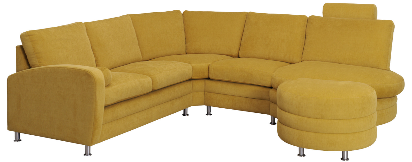
PALERMO Y-O-Q-N-K+L (M/DUNTOP)