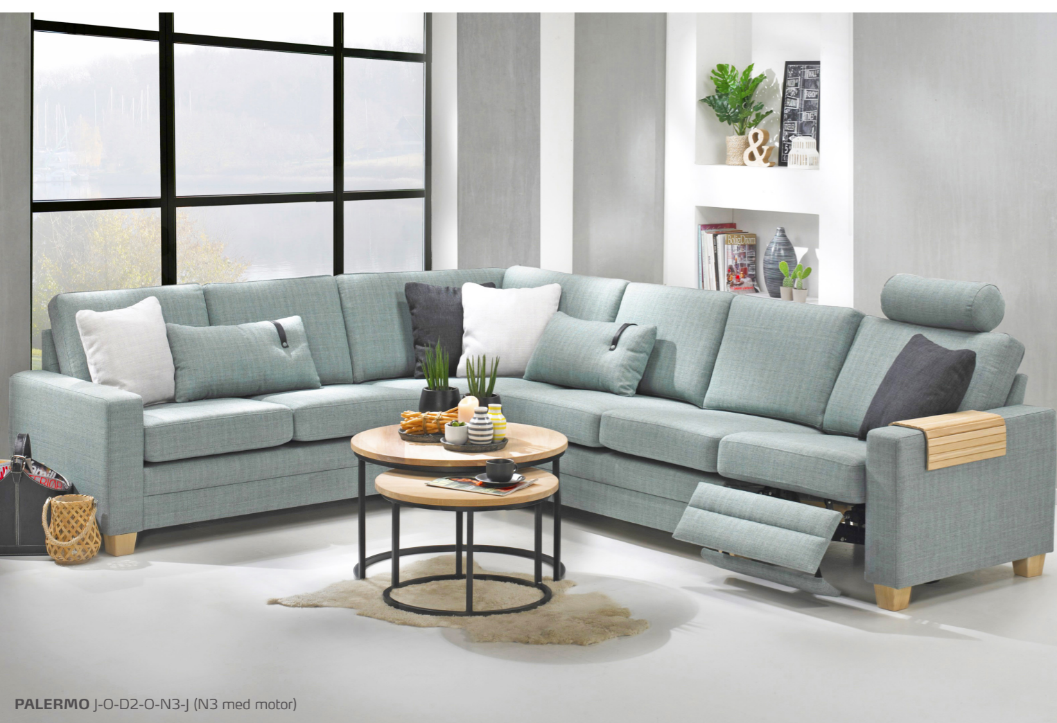
PALERMO J-O-D2-O-N3-J (N3 med motor)

Når du skal konstruere din helt egen Palermo sovesofa med modul F5, har du et utal af kombinationsmuligheder. Armlæn og ben fås i en række forskellige varianter. Alt sammen giver dig plads til at skabe en sofa, der matcher dit hjem 100 procent.