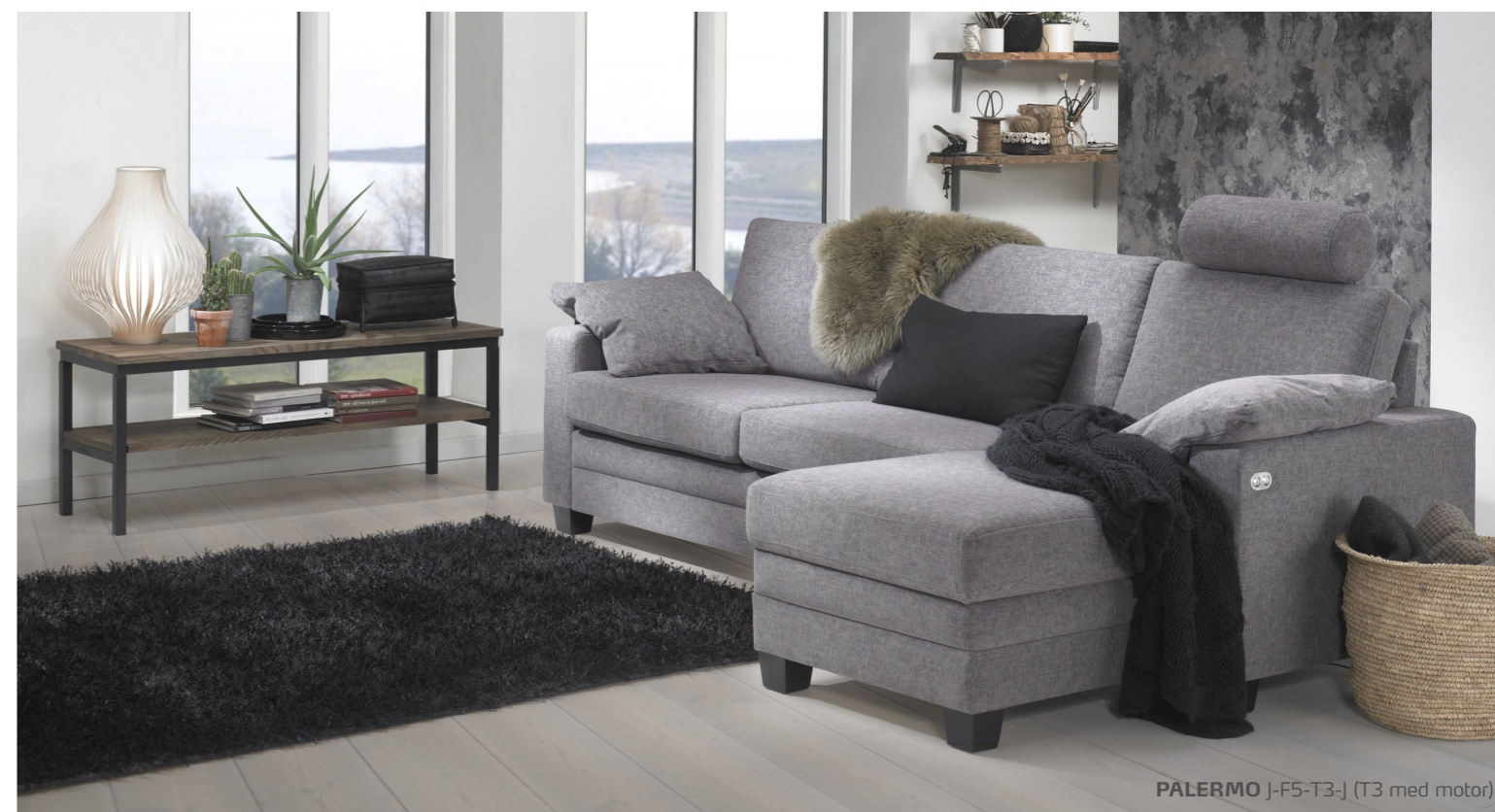
PALERMO J-F5-T3-J (T3 med motor)