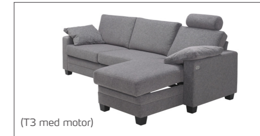
(T3 med motor)